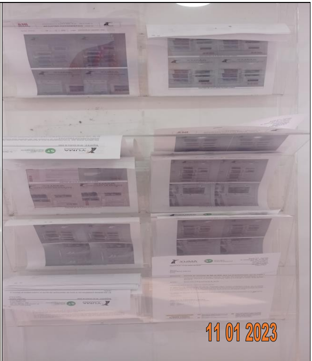
EDICTO R_36105 YC-CRT-122603